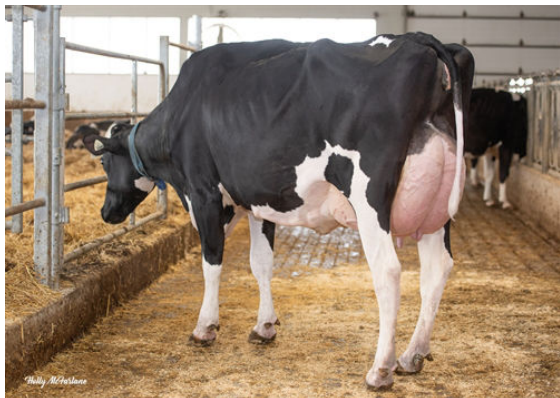
SHELAND PERFECT DAYBREAK GRANDDAM